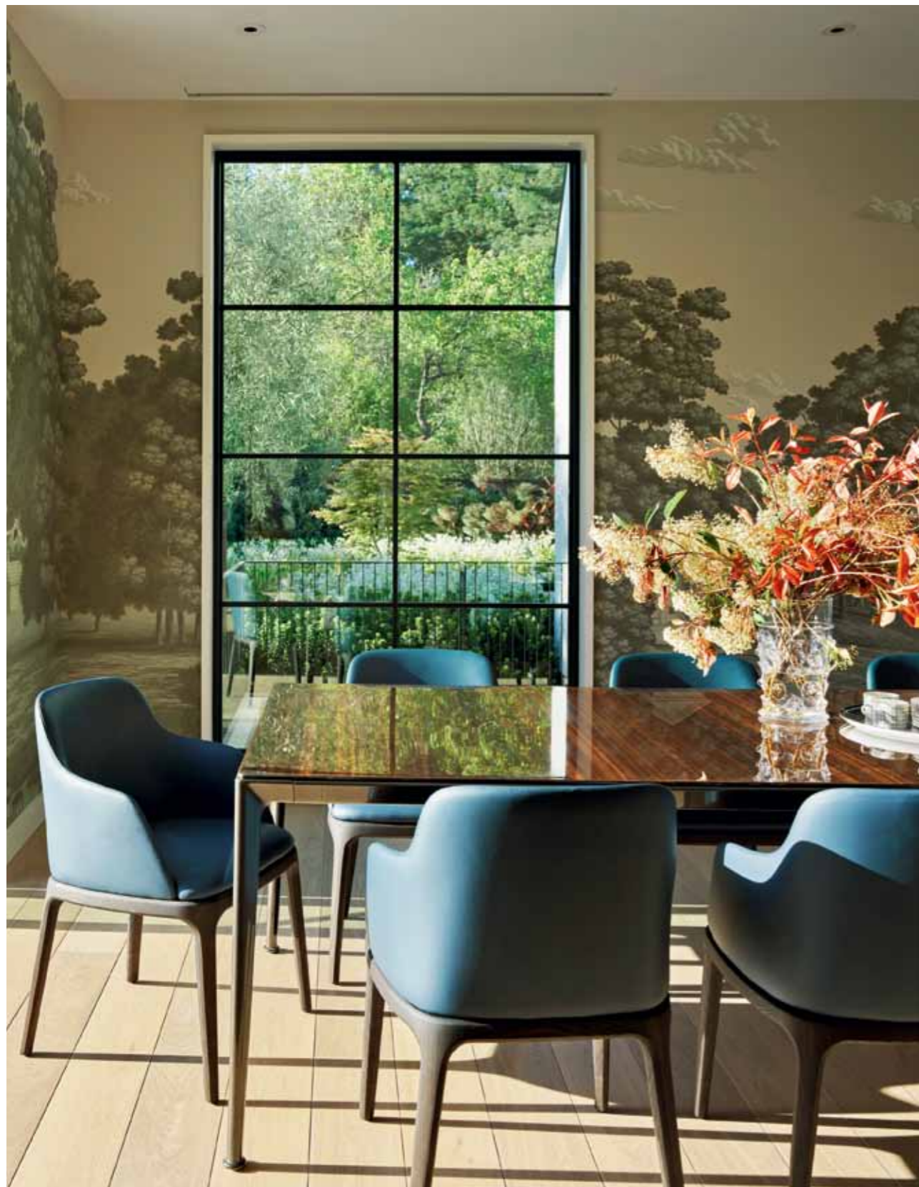
JADALNIA z dekoracyjną tapetą de Gournay stanowi kontrast dla wystroju pozostałych pomieszczeń w domu. Zachwyca zestawienie ręcznie malowanych krajobrazów (na tapecie) z eleganckimi liniami stołu Mirto B&B Italia i krzeseł Grace marki Poliform.