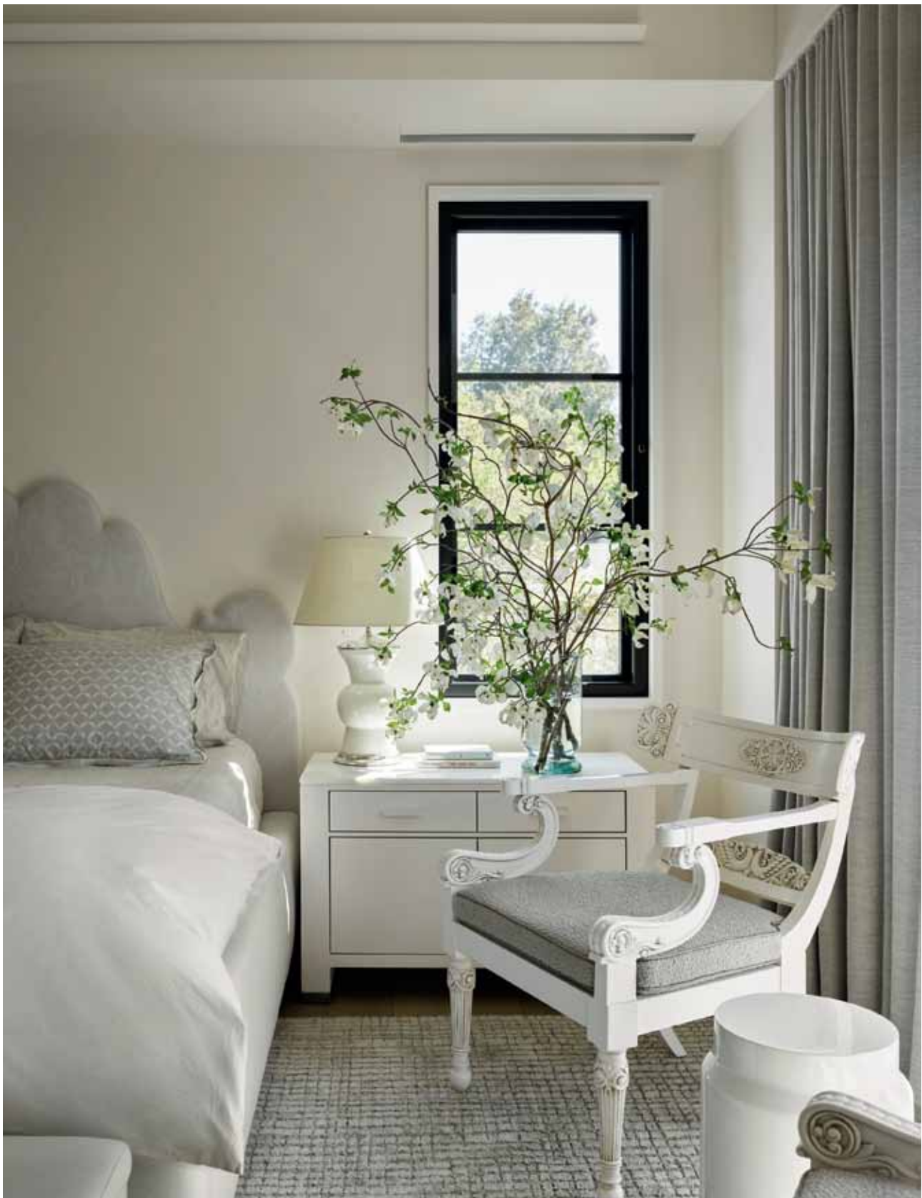
GLÓWNA SYPIALNIA tonie we wszystkich odcieniach bieli. Łóżko z fantazyjnym zagłówkiem oraz drewniany fotel pochodzą z dawnego domu właścicieli, ale zyskały nową tapicerkę. W obydwu przypadkach zostały wykorzystane eleganckie tkaniny Rogers&Goffin, które świetnie komponują się z dywanem od Stark Carpet.