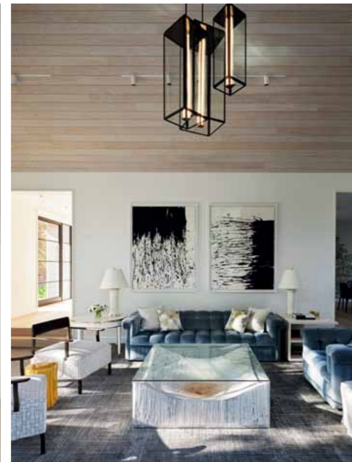
W GŁÓWNYM HOLLU uwagę przyciąga spektakularny żyrandol Arc Well z amerykańskiej manufaktury Allied Marker, natomiast w salonie – oryginalny stolik ze szklanym blatem i efektowną, akrylową podstawą.

A therton, dość niepozorne na pierwszy rzut oka miasto w Kalifornii, jest jednym z najlepszych i najdroższych adresów w Stanach Zjednoczonych. I to nie tyle ze względu na jego malownicze otoczenie, ale z uwagi na to, że znajduje się zaledwie 20 minut drogi od Doliny Krzemowej. Dlatego w krajobraz miasta wpisane są należące do potentatów branży technologicznej spektakularne posiadłości, wspaniałe wille i rezydencje. Jedną z nich powstała w wyniku interesującej transformacji starego domu w stylu angielskim w nowoczesną, przestronną nieruchomość. Nowi właściciele, młode małżeństwo z dwójką dzieci, dosłownie zakochali się w otaczającym stary dom rozległym ogrodzie. Szkopuł był w tym, że zastana architektura całkowicie oddzielała od niego wnętrza domu. Para chciała wygodnego, jasnego domu rodzinnego, który miałby przestronne pomieszczenia otwarte na siebie i krajobraz wokół, zatrudniła więc ekspertów ze studia architektonicznego BAMO, którzy podjęli się kompletnego przeprojektowania budynku. Nowy projekt zakładał m.in.